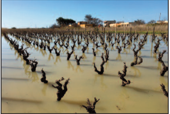
UN VIGNETO DI CONTRADA CASA BIANCA