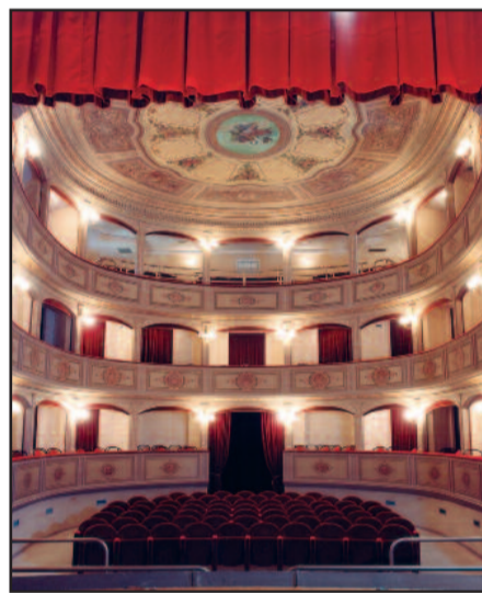
TEATRO COMUNALE "E. SOLLIMA"