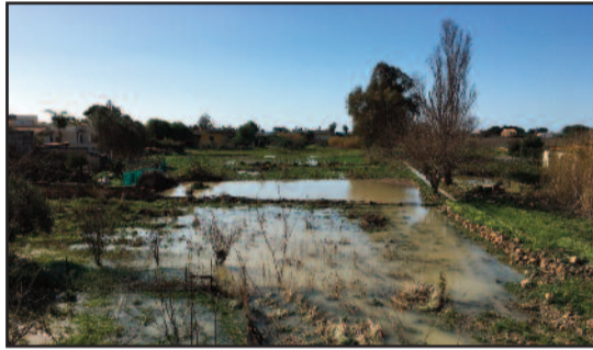
IL SOSSIO DOPO L'ESONDAZIONE