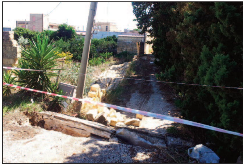
UN TRATTO DEL TERRENO SPROFONDATO

Cominciano le piogge e la periferia di Marsala cade a pezzi. Non si tratta di un modo di dire, ma è accaduto davvero. Dopo l'acquazzone di poche ore fa gli abitanti della via Salemi hanno chiamato i vigili del fuoco del distaccamento di corso Calatafimi a causa di un singolare fenomeno verificatosi accanto a casa loro. All'altezza dei numeri civici 112-115 il terreno si era improvvisamente sbancato creando una voragine lunga trenta metri, profonda tre metri e ampia circa settecento metri quadri. Inutile dire che in poche ore si è diffuso lo stato di allarme tra gli abitanti. I vigili del fuoco hanno, in primo luogo, delimitato tutta la zona interessata dallo sprofondamento e poi hanno avviato rilievi per verificare se ci sia il rischio di ulteriori sprofondamenti nelle zone limitrofe. Il crollo ha riguardato una stradina sterrata, un muro che delimitava una proprietà privata e una lunga fila di cipressi alti circa sei metri che sono finiti giù, senza però abbattersi. Pare, da una prima analisi che anche una delle tre case limitrofe abbia subito delle le-