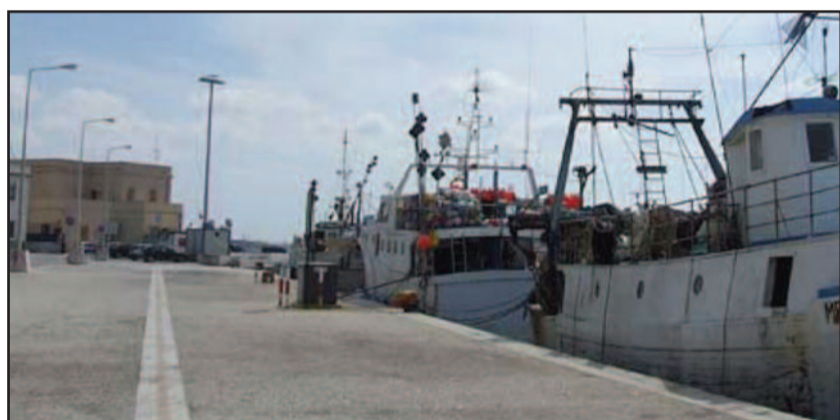
UNA BANCHINA DEL PORTO DI MARSALA

dell'illuminazione. "C'è anche un problema di sicurezza - ci ha detto Parrinello -, infatti molti sono stati i furti all'interno delle imbarcazioni. Furti favoriti dal buio totale in cui versa l'intera struttura. A seguire le varie fasi del prossimo intervento negli uffici competenti a Palermo, come scrive in un comunicato stampa la sua segreteria, è stato il deputato regionale Paolo Ruggirello che ha colto l'invito che il comandante uscente della Capitaneria di Porto di Marsala, Raffaele Giardina, ha più volte rivolto a tutti i soggetti preposti. "Proprio in occasione del suo avvicendamento con il neo comandante Gianluigi Bove, è stato fatto il punto della situazione per un disagio che va avanti da troppo tempo, la cui soluzione deve essere costantemente monitorata e deve essere considerata una priorità - afferma Ruggirello". Il porto di Marsala fa i conti con guasti elettrici e di furti di cavi di rame sin dal 2013. Una situazione che è andata sempre a peggiorare fino ad arrivare all'interdizione di alcune zone della struttura, causando disagi alle attività di pesca. "Dopo i continui solleciti, fatti dal comandante Giardina - ha detto Ruggirello - per disporre interventi di riorganizzazione e