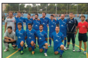
IL "CITTÀ DI MARSALA"

sultare pericoloso per la porta difesa dall'ottimo Cudia. La partita si racconta tutta nel primo tempo, dove per i primi minuti le due squadre si sono studiate cercando di rendersi pericolose con qualche occasione da ambo le parti, ma mantenendo il risultato stabile sullo 0 a 0. Poi è il Marsala a sbloccare il risultato con Nuccio, ma pochi minuti dopo arriva il pareggio dei palermitani che rimette a posto le cose. I padroni di casa, apparsi più compatti e agguerriti degli ospiti tornano in vantaggio e con il Pa-