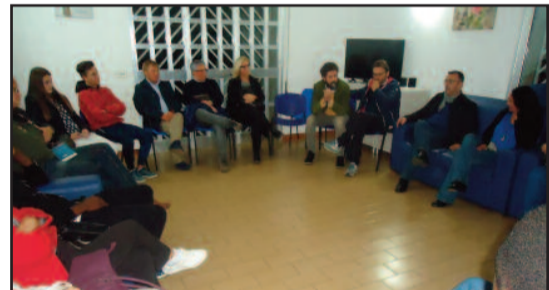
UN MOMENTO DELL'INIZIATIVA

tato il suo libro, scritto con Stefano Allievi, “Tutto quello che non vi hanno detto sull'immigrazione” (Laterza). Nel dialogo con Dalla Zuanna, i giovani migranti hanno evidenziato alcuni problemi: i tempi troppo lunghi della burocrazia italiana e delle pratiche per la richiesta di asilo politico o di altro tipo di protezione internazionale. Il senatore ha assunto l'impegno di verificare, insieme al sindaco, la situazione nel trapanese per cercare di snellire i tempi. “Quando ci avviciniamo al mondo dell'immigrazione – ha detto Dalla Zuanna - lo facciamo spesso con pregiudizi. Si pensa ad un sistema di accoglienza basato sul lucro. Ho trovato una casa gestita con professionalità, dove i ragazzi potranno acquisire la padronanza della lingua per essere poi accompagnati verso un'attività lavorativa. Non è affatto vero che la presenza dei migranti si pone in concorrenza con i nostri giovani che cercano lavoro: si tratta di due diversi segmenti del mercato. A Petrosino, ad esempio, c'è la difficoltà di trovare persone disponibili per la vendemmia”. Dalla Zuanna inoltre, ha fatto sapere che il fenomeno delle migrazioni non diminuirà finché non si riuscirà a controllare le partenze dalla Libia. “Le nuove