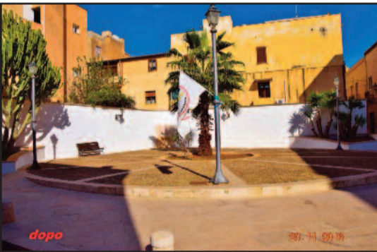
LE FOTO INVIATE DAL MEETUP

“La voglia di riappropriarsi degli spazi comuni e l'amore per la nostra Città”. Questo è lo spirito che ha mosso il Meetup Marsala in MoVimento, che giorni fa hanno riquilibrato la piazzetta Anna e Maria Bonafede, vicino la via Di Pietra, in pieno centro. Come si può notare dalle foto, la piazzetta era in balia di scritte e murali senza logica alcuna. Gli attivisti del movimento si sono prodigati a ripulirla e risistemarla. “Auspichiamo che ogni cittadino, spinto dall'amore per la sua casa trovi stimolo, in questi spontanei gesti, per prendere a cuore ogni angolo della Città e adoperarsi affinché Marsala risorga e ritorni a risplendere di nuova luce – affermano dal Meetup -. Nell'attesa che anche chi ci amministra inizi ad amare questa nostra incantevole Città”. [ c. m. ]