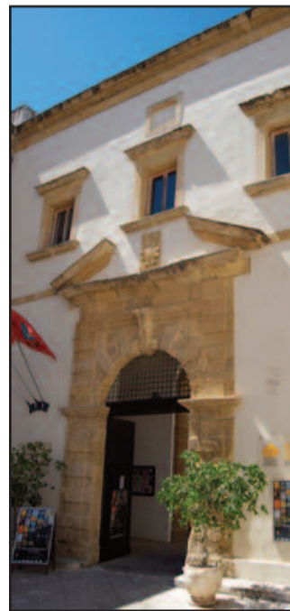
L'INGRESSO DELL'EX CONVENTO DEL CARMINE