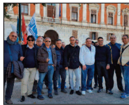
UN MOMENTO DEL SIT-IN