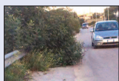
IL TRATTO DI STRADA OGGETTO DELLA SEGNALAZIONE

Nei giorni scorsi, come spesso accade, siamo stati contattati da una cittadina marsalese che ci ha raggiunti in redazione per informarci di un problema con cui si confronta quotidianamente: la presenza di rami e sterpaglie che hanno invaso parte della carreggiata da cui ogni giorno si trova a transitare con la propria automobile. Si tratta di un tratto di strada che congiunge la zona di Rakalia con lo scorrimento veloce. "Le sterpaglie invadono le corsie - spiega la cittadina lilibetana - e costringono le macchine a spostarsi pericolosamente al centro strada. Non oso immaginare cosa potrebbe succedere con l'approssimarsi dell'inverno. Senza considerare la sporcizia e i sacchetti dei rifiuti buttati qua e là, conseguenza anche dell'inciviltà delle persone che fanno troppa fatica a buttarli dove dovrebbero". La signora dice di aver già segnalato il problema al Comune. Risultato? La spazzatura è stata tolta, ma le sterpaglie restano. La nostra redazione ha quindi contattato l'assessore al verde pubblico Nino Barraco, che ci ha assicurato che nei prossimi giorni gli operatori comunali interverranno sul tratto interessato, in modo che i veicoli potranno tornare a transitare in piena sicurezza. "Purtroppo - sottolinea l'assessore Barraco - in periferia ci sono anche altri casi come questo. Naturalmente ci ritroviamo di fronte a situazioni che abbiamo ereditato dal passato e su cui stiamo comunque già intervenendo".