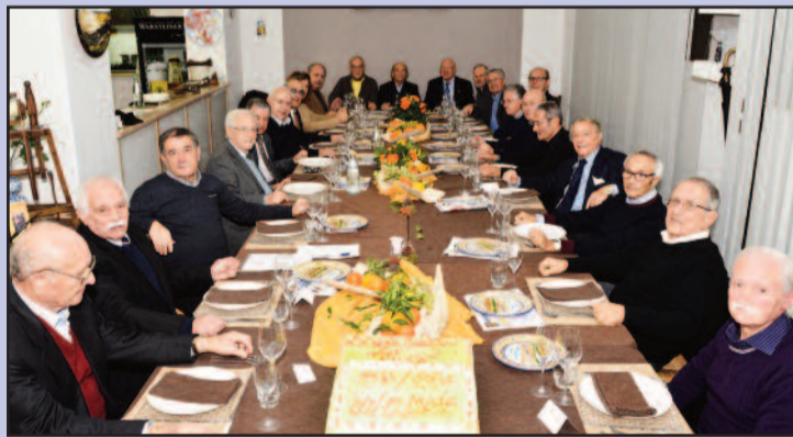
GLI EX ALUNNI DEL "LITTORIO"