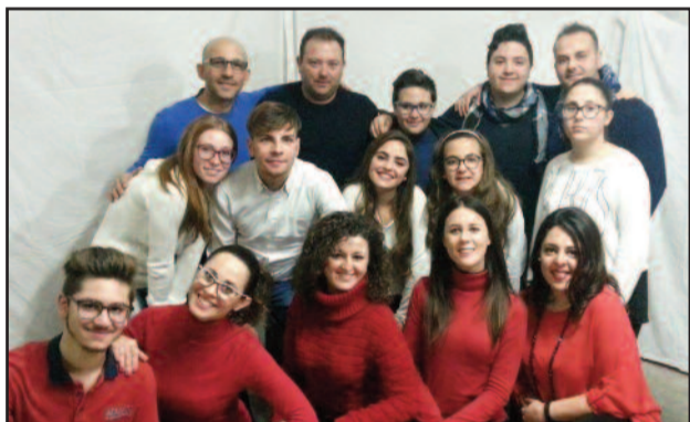
GLI ARTISTI DI #MARSALAFORPARIS