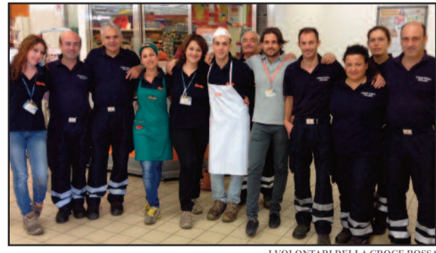
I VOLONTARI DELLA CROCE ROSSA

lia quasi 2 milioni di famiglie, 5 milioni di persone, si trovano in stato di povertà assoluta. La crisi economica in atto ha aumentato lo stato di povertà, colpendo fasce di popolazione in precedenza non interessate a questo fenomeno. Croce Rossa Italiana distribuisce generi alimentari e beni di prima necessità alle famiglie in difficoltà, nelle mense, nei comuni e nelle strutture dedicate su tutto il territorio nazionale. In questa logica, il Gruppo Selex si è dato disponibile a sostenere la CRI nella raccolta di generi alimentari e prodotti igienico-sanitari nei punti vendita del Gruppo, con un'iniziativa di solidarietà in aiuto delle persone più bisognose. Nei due precedenti appuntamenti della campagna di raccolta, in tutta Italia sono state raccolte 60.304 confezioni, pari a 534 tonnellate di generi alimentari. In particolare, 1.292 confezioni, corrispondenti a 19 tonnellate di generi alimentari solo in Sicilia. Proprio a tal fine, il Comitato locale della Croce Rossa di Marsala prossimamente organizzerà un corso per volontari. Per informazioni chiamare i numeri 0923 716326 - 338 3098438, oppure scrivere a cl.marsala@cri.it o recarsi personalmente presso la sede di via degli Atleti, 11 - vicino l'area attrezzata in zona Stadio.