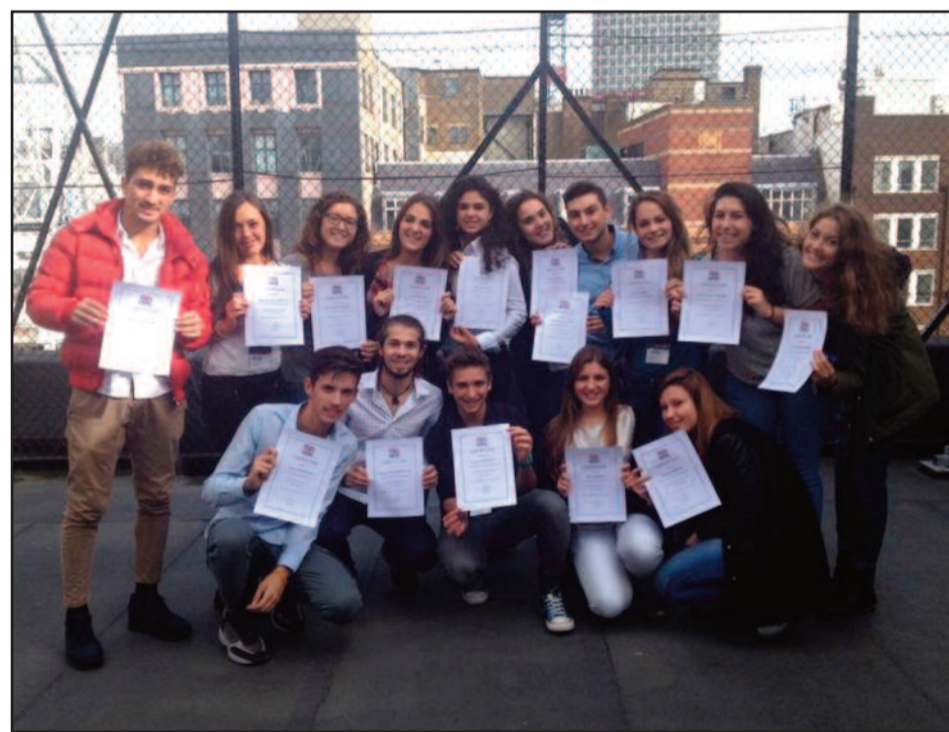
I RAGAZZI DEL COMMERCIALE A LONDRA