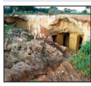
LA VORAGINE DI CIDA AMABILINA

Con una delibera del Commissario Straordinario Giovanni Bologna, a sostituzione della Giunta Municipale, ha fatto sapere che l'Amministrazione comunale intende adottare una politica di tutela del territorio individuando le possibili iniziative per la salvaguardia e la tutela dell'ambiente e del territorio. Lo scorso anno sia ad Amabilina che nella via Salemi ci sono stati degli sprofondamenti dei terreni ed altri crolli, anche parziali, sono avvenuti nelle zone limitrofe ed in zona Stadio per fortuna senza causare danni a persone o cose. Anche in via Tunisi si è aperta una voragine profonda dieci metri tra due edifici che mette a rischio le abitazioni del luogo. Tutti episodi da ric collegare al vasto crollo che anni fa avvenne in contrada Timpone d'Oro. A tal fine il Commissario ha chiesto al dirigente del Settore responsabile della Protezione Civile, per avviare le iniziative necessarie all'avvio delle indagini conoscitive e delle possibili soluzioni dei crolli avviando una fattiva collaborazione a titolo gratuito con l'Università di Palermo, Dipartimento di Scienza della Terra e del Mare.