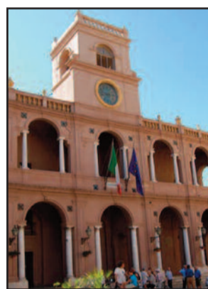
PALAZZO VII APRILE

Il Bilancio arriva nelle mani dei consiglieri