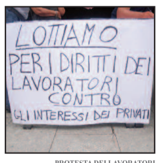
PROTESTA DEI LAVORATORI