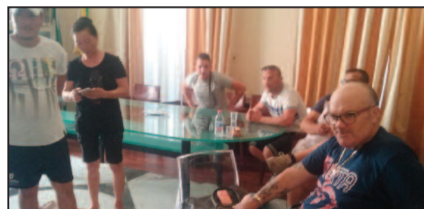
LCOMMERCianti IN SALA GIUNTA

viene accreditato come vice sindaco -, cercheremo di salvaguardare anche il lavoro di quanti hanno diritto. Tuttavia da quanto ci è noto sulle costruzioni in lamiera della zona Stadio, pende una ordinanza di demolizione. Siamo sensibili ai problemi della gente, ma non possiamo violare la legge. Valuteremo assieme agli uffici competenti il da farsi". Per questo e per capire bene la situazione, l'incontro è stato aggiornato a venerdì prossimo quando i commercianti si recheranno al comune assieme ad un loro legale di fiducia e ad un tecnico privato che potrebbe proporre eventuali margini di sanatoria. "Occorre dire - ha concluso Licari - che il problema che stiamo affrontando ci è stato "passato" dalle precedenti amministrazioni che hanno evitato di affrontarlo, lasciandoci questa eredità. Faremo tutto ciò che è nelle nostre facoltà". [ gaspare de blasi ]