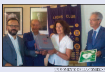
UN MOMENTO DELLA CONSEGNA