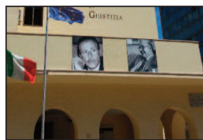
TRIBUNALE DI MARSALA

presso la Procura. Tutto sarebbe scaturito dal fatto che il poliziotto avrebbe scoperto che la moglie lo tradiva e la avrebbe costretta ad andare dal notaio per cedergli la sua quota di proprietà dell'abitazione familiare e poi, con i genitori di lei, la avrebbe chiusa a chiave in casa, per circa 24 ore, per paura che se ne andasse con l'altro uomo. Il poliziotto - difeso da Edoardo Alagna - è accusato anche di percosse alla moglie e ingiurie all'altro uomo. Ieri Nesta e gli altri si sono sottoposti ad interrogatorio: "Affronteremo il dibattimento con estrema