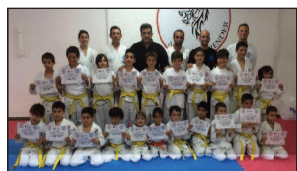
FOTO DI GRUPPO