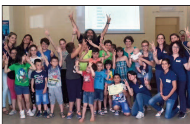
FOTO DI GRUPPO - UN MOMENTO DELL'INIZIATIVA