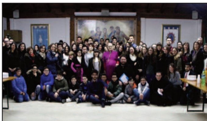
UN MOMENTO DELLA VISITA