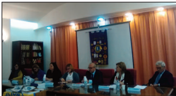
UN MOMENTO DEL CONVEGNO