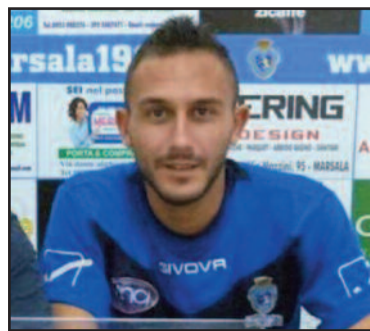
IL BOMBER CORTESE

leratore e tentano di chiudere il match. Ci riescono al 43' quando Giardina di testa batte nuovamente Pellitteri, la bandierina dell'assistente Vitranò vanifica il bel gesto atletico del centrocampista azzurro giudicato in posizione di off side. Nella ripresa gli azzurri controllano bene la gara e contengono la reazione dei ragazzi di mister Maggio. Al 67' sui piedi di Giammanco la migliore occasione dei biancazzurri locali, para Maltese. Al 71' per presunto fallo in area su Hader i cammaratesi reclamano un CALCIO di rigore, per l'arbitro è tutto regolare. Un minuto dopo la scena si ripete a parti invertite. Il fallo stavolta è ai danni di Cortese, anche in questo caso il signor Di Graci lascia proseguire. Al minuto 84 occasione gol per gli azzurri. Il diagonale di Convitto trova pronto Pellitteri che respinge. Al minuto 90+1' Giammanco commette fallo su Totò Maltese e si becca il rosso diretto: Kamarat in dieci. Tre minuti dopo, è il 94', arriva il triplice fischio del direttore di gara che sancisce la meritata vittoria dei ragazzi di mister Pergolizzi...". Un successo che sicuramente rappresenta un ottimo volano in vista della sfida con il Giarre, valevole per la finale regionale di Coppa Italia, in programma domani pomeriggio a Mascalucia. Gli azzurri partiranno questo pomeriggio alla volta della città etnea con il dichiara-