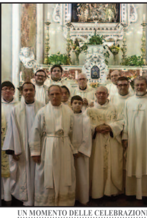
UN MOMENTO DELLE CELEBRAZIONI