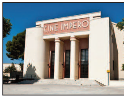
IL TEATRO IMPERO DI MARSALA