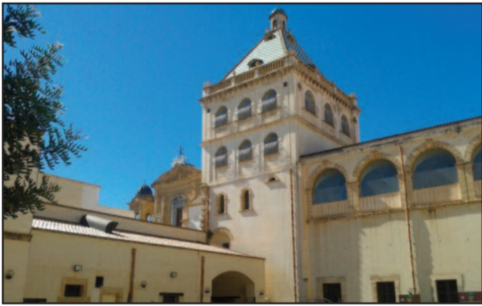
COMPLESSO SAN PIETRO