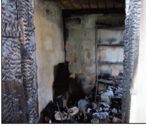
IL MAGAZZINO DI CDA AMABILINA

Tutte le prese sono esplose in un attimo. La saetta ha causato anche danni alla casa dei vicini. Qui è stato bruciato un computer. I due impianti sono distrutti. E già alle 6 del mattino sono intervenuti i tecnici Enel per ripristinare la corrente, ma si tratta di un lavoro tutt'altro che veloce. Altri due vicini di casa hanno avuto distrutte le antenne per la ricezione dei segnali tv. Solo cinque anni fa un altro fulmine era caduto a pochi metri di distanza, formando un voragine di cinque metri quadrati in un terreno limitrofo. [ c. p. ]