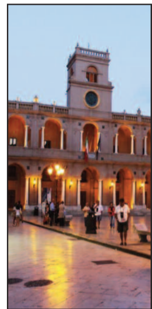
PALAZZO VII APRILE

Mercoledì nuova riunione del Consiglio comunale