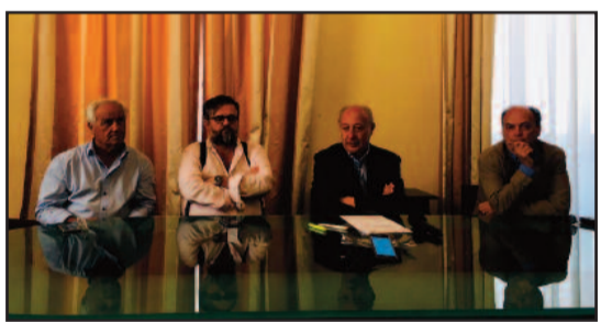
UN MOMENTO DELLA CONFERENZA STAMPA

più autorevole”. Tra la fine del 2006 e l'inizio del 2007, le ditte Bonafede e Morsello hanno presentato opposizione, sostenendo che con l'approvazione della variante urbanistica da parte del Commissario straordinario nel 2005 (il Consiglio comunale a quel tempo non era in carica in seguito all'autoscioglimento) la valutazione dell'esproprio doveva essere riconsiderata. Il mancato accordo tra ente e privati, ognuno rimasto fermo sulle proprie convinzioni, ha portato all'inizio dell'iter processuale, conclusosi lo scorso 30 aprile, con due pronunciamanti definitivi da parte della Cassazione, che ha di fatto accolto la tesi del legale delle famiglie Bonafede e Morsello, facendo riferimento a due sentenze del 2008, secondo cui nel calcolare l'esproprio si sarebbe dovuto tener conto della variante urbanistica approvata, riconoscendo ai privati 40 euro per ogni metro quadro. Alla luce di ciò, il Comune di Marsala deve adesso corrispondere alle due parti interessate una