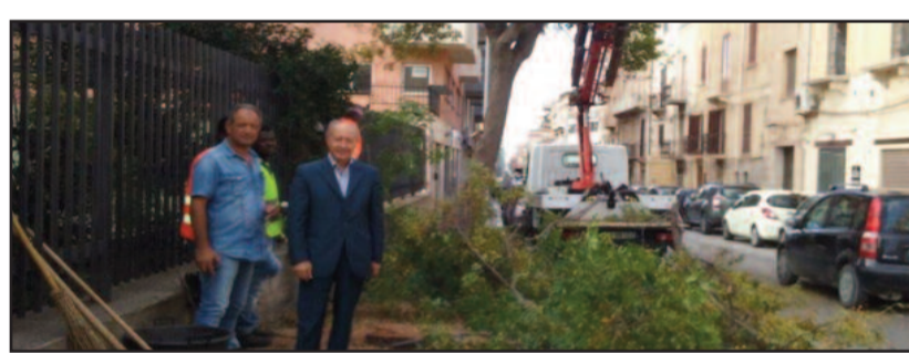
IL SOPRALLUOGO DEL SINDACO IN VIA AMENDOLA

N ei giorni scorsi il forte vento di scirocco ha causato non pochi problemi alla ventosa città di Marsala. Diversi rami si sono staccati dagli alberi, principalmente nel centro storico ed urbano, provocando disagi alla viabilità e causando seri danni ad autovetture, come accaduto venerdì in Piazza del Popolo: sul posto sono intervenuti subito le squadre del Verde Pubblico del Comune di Marsala che, in alcuni casi, come a Porta Garibaldi, avevano già transennato l'area per potare i tronchi. Ma a ciò si è aggiunto, stamani, l'urgente intervento degli operatori del Settore in via Amendola. Qui come era accaduto per le piante di via Sibilla, gli al-