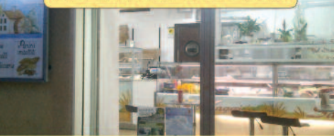
TAVOLA CALDA - PASTICCERIA FORMAGGI - SALUMI

C.da Strasatti, 284/a - Via Nazionale 91025 MARSALA (TP) Cell. 329.9644924