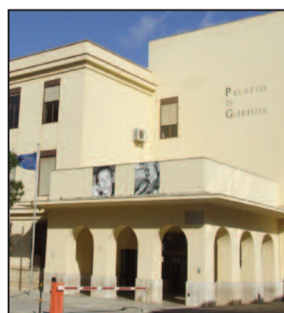
TRIBUNALE DI MARSALA