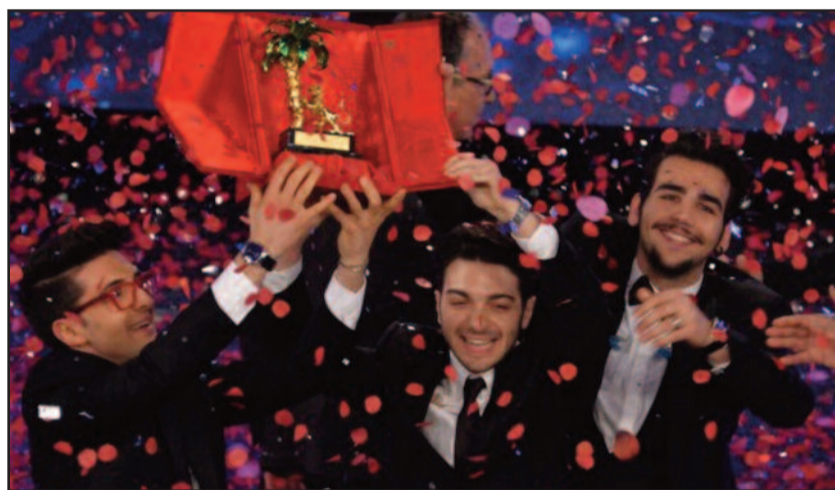
IL VOLO VINCE IL 65° FESTIVAL DI SANREMO

POLITICA Il Consigliere di Futuro per Marsala aveva denunciato la mancata indizione di gare per 24 milioni di euro