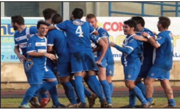
UN MOMENTO DELLA PARTITA

CALCIO A 5 Contro il Real Parco rimediato un 13 a 4 che fa male. Bisogna recuperare al più presto