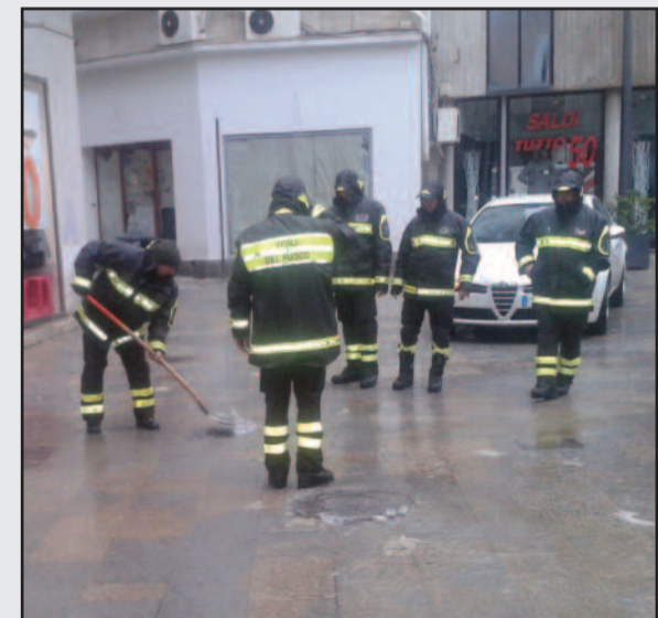
PORTA MAZARA - IERI POMERIGGIO