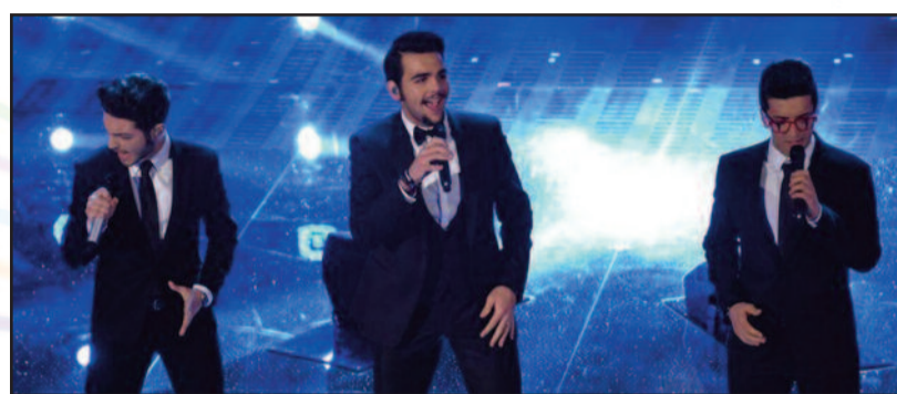
IL VOLO - GIANLUCA GINOBLE, IGNAZIO BOSCHETTO E PIERO BARONE