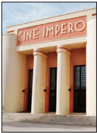
TEATRO IMPERO DI MARSALA