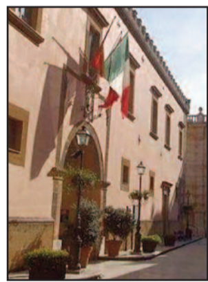
SEDE DEL COMUNE DI MARSALA

Comune: riprendono i rientri pomeridiani