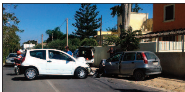
LO SCONTRO DI VIA TRAPANI