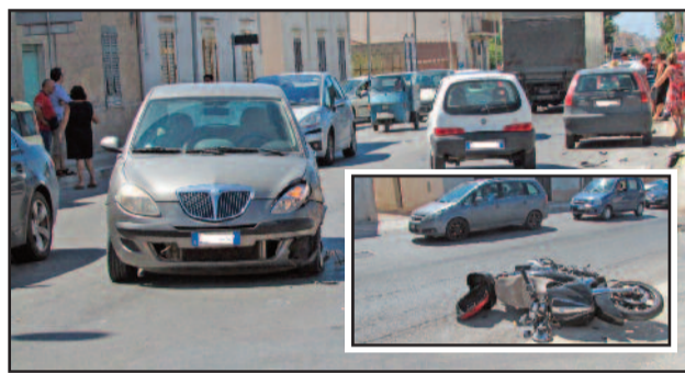
L'INCIDENTE DI VIA SALEMI