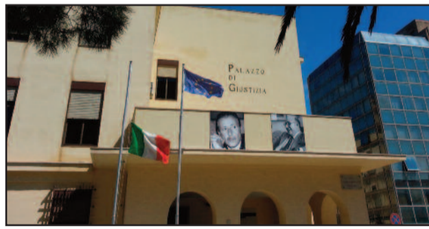
TRIBUNALE DI MARSALA

Stamani davanti al Tribunale monocratico di Marsala è attesa la deposizione dei tredici marsalesi sotto processo per truffa. Secondo l'accusa: "Avrebbero alterato le certificazioni mediche allegando tracciati ECG (elettrocardiogramma) di altre persone realmente cardiopatiche". I fatti contestati risalgono al 2006. Sono alla sbarra sia i medici della commissione che avrebbe dovuto analizzare le domande per accordare la pensione di invalidità che i richiedenti. Ad ogni modo la pensione non è mai stata erogata. Le indagini sono state svolte dalla Guardia di Finanza e il processo ha preso il via il 2 ottobre del 2012. Sono parti lese: l'INPS e l'ASP di Trapani. [ c. p. ]