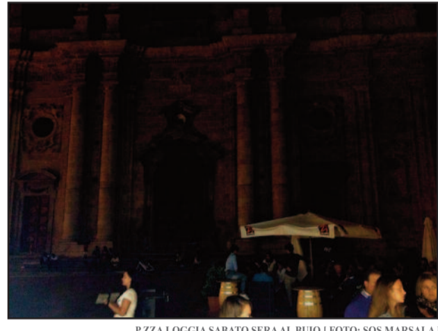
Piazza Loggia Sabato sera al buio