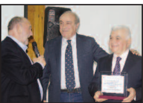
UN MOMENTO DELLA PREMIAZIONE