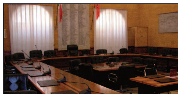
L'AULA CONSILIARE DI PALAZZO VII APRILE