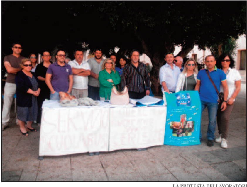
LA PROTESTA DEI LAVORATORI

Si ritorna a parlare della vicenda relativa ai lavoratori degli scuolabus. Volendo riassumere brevemente, il servizio doveva partire il 1° di ottobre con un nuovo bando in quanto la precedente società che lo gestiva ha recesso dal contratto.