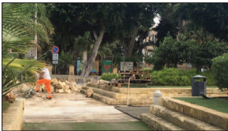
I GIARDINI DI PORTA NUOVA

Ha colto di sorpresa lo smantellamento dei giardini di Porta Nuova. Sembra che non ci sia stata una previa comunicazione ma l'Ufficio Tecnico del Comune di Marsala ha ieri mattina, subito confermato: i giardini - che tanto hanno fatto discutere negli ultimi anni - sono stati parzialmente smantellati. Si parla, nello specifico, di interventi "Safety e Security", già richiamati sia dal Capo della Polizia (che ha diramato un'apposita Circolare in giugno) che dalla Prefettura di Trapani (nel corso della riunione del Comitato Ordine e Sicurezza dello scorso agosto). Una decisione presa anche a seguito di un'ispezione del sindaco e degli uffici preposti che porterà ad eliminare i due muri che costeggiano la strada. Via anche le aiuole e gli alberi al loro interno, così come il tappeto verde, che era ormai logoro e luogo di insetti soprattutto con la brina mattutina, ma rimarranno le aiuole e le piante centrali ed anche il parquet di legno laterale. L'Amministrazione comunale ha provveduto d'ufficio ad asportare parte del giardino. Questo, era stato "costruito" e fortemente voluto dall'ex sindaco Giulia Adamo. Doveva essere temporaneo ma da allora è divenuto stabile nonostante i continui malumori dei cittadini che ne hanno chiesto più volte lo smantellamento. Negli anni è divenuto ritrovo di gio-