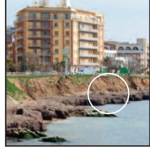
IL LUOGO DEL RITROVAMENTO

In prossimità della battigia ricadente nella zona di Capo Boeo, a Marsala, nei pressi del distributore di carburante ERG, è stato ritrovato un presunto ordigno bellico di piccole dimensioni e di forma cilindrica. A segnalare il ritrovamento all'Ufficio Circondariale Marittimo della Capitaneria di Porto sono stati Carabinieri di Marsala che hanno emanato proprio ieri un'ordinanza. Immediatamente è partita l'ispezione per verificare la pericolosità o meno dell'ordigno da parte dei militari di Circolare. Al fine di adottare tutte le misure a salvaguardia della pubblica incolumità, il capitano della Guardia Costiera, Raffaele Giardina, ha emanato un'ordinanza con la quale vieta assolutamente l'accesso e la sosta per un raggio di 50 metri dal punto del ritrovamento fino a che il personale militare e civile impiegato non provveda alla bonifica e rimozione del presunto ordigno bellico. La zona è stata appositamente "transennata". Non è la prima volta che nei nostri mari vengono ritrovati ordigni bellici, in particolare che risalgono alla Seconda Guerra Mondiale. Ancora non si conosce l'entità ed il periodo dell'ordigno ritrovato lungo la costa di Capo Boeo, ma fatto sta che questo "esplosivo" è stato ritrovato nella battigia pericolosamente vicino al distributore di benzina che si trova proprio lì. [ ro. ma. ]