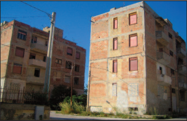
GLI ALLOGGI POPOLARI DI VIA MAZARA