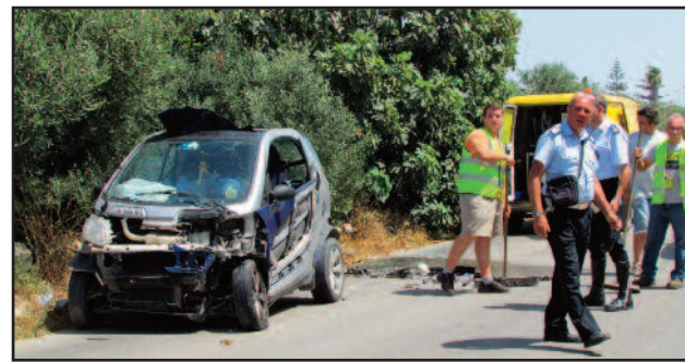
IL LUOGO DELL'INCIDENTE