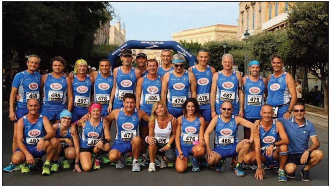
LA POLISPORTIVA MARSALA DOC

È stata massiccia (35 tesserati) la partecipazione degli atleti della Polisportiva Marsala Doc alla 20° edizione del Trofeo "Sale & Saline", ormai appuntamento fisso e di rilievo nel calendario dell'atletica leggera siciliana. Dieci chilometri da correre quasi tutti d'un fiato tra via Fardella e il centro storico, con arrivo all'interno di Villa Margherita. Volevole sia come prova del GrandPrix regionale, che provinciale, all'importante competizione, vinta da Filippo Lo Porto (Universitas Palermo), con il tempo di 33 minuti e 39 secondi, hanno partecipato quasi 800 atleti arrivati da tutta la Sicilia. Tra i marsalesi, il primo a tagliare il traguardo è stato, naturalmente, Pietro Paladino, 22°