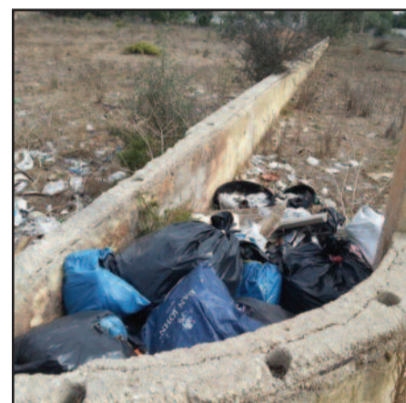
UNA DISCARICA A CIELO APERTO IN CONTRADA COZZARO