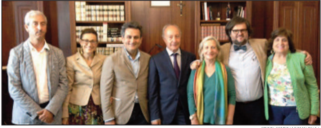
GIUNTA COMUNALE DI MARSALA