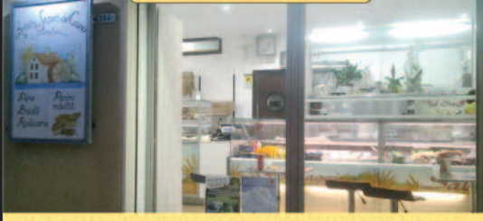
TAVOLA CALDA - PASTICCERIA FORMAGGI - SALUMI C.da Strasatti, 284/a - Via Nazionale 91025 MARSALA (TP) Cell. 329.9644924

UNIVERSAL Distribuzione volantini - Pubblicità mobile - Cartellonistica