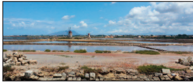
LO STAGNONE DI MARSALA

gestore subirebbe pressioni ancora maggiori da parte dei privati e da parte di tanti soggetti che, per ragioni diverse, non hanno a cuore la tutela e la salvaguardia delle aree protette". In più Zanna contesta alcune posizioni espresse in passato dal sindaco Adamo in merito alla Riserva dello Stagnone, con particolare riferimento alla navigabilità della laguna. Per Legambiente Sicilia l'esempio da eseguire è quello dello Zingaro, la cui tutela è curata dall'Azienda Regionale delle Foreste Demaniali. Anche se, come spiega Zanna, "ci sono numerosi casi di aree protette gestite direttamente dalle associazioni ambientaliste". Nello Stagnone, però, bisogna fare i conti anche con i privati, dalla Fondazione Whitaker ai diversi soggetti presenti sull'Isola Lunga. Proprio per questo, per Zanna, "una soluzione praticabile potrebbe portare all'istituzione di un tavolo tecnico per la creazione di un consorzio di cui farebbero parte il Comune, i privati e le associazioni ambientaliste". [vincenzo figlioli]