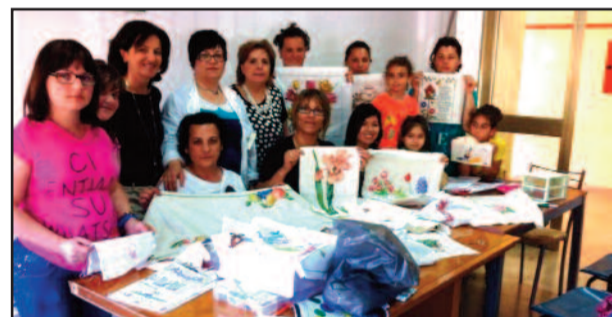
LE PARTECIPANTI AL PROGETTO