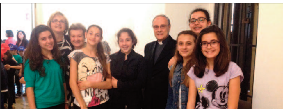
GLI STUDENTI CON IL VESCOVO MOGAVERO

In occasione dell'incontro di papa Francesco con il mondo della scuola svoltosi il 10 maggio scorso, l'Ufficio Scolastico Diocesano ha indetto un concorso per le scuole di ogni ordine e grado dal titolo "La scuola che vorrei?". Tutti gli alunni sono stati invitati ad esprimere attraverso forme diverse (cartelloni, video, poesie, canzoni ecc.) i loro pensieri, bisogni e sogni sul mondo della scuola. Giovedì 29 maggio alle ore 10.30, a Mazara del Vallo, è stata inaugurata la mostra degli elaborati prodotti dagli alunni delle diverse scuole della Diocesi. Il Vescovo Monsignor Domenico