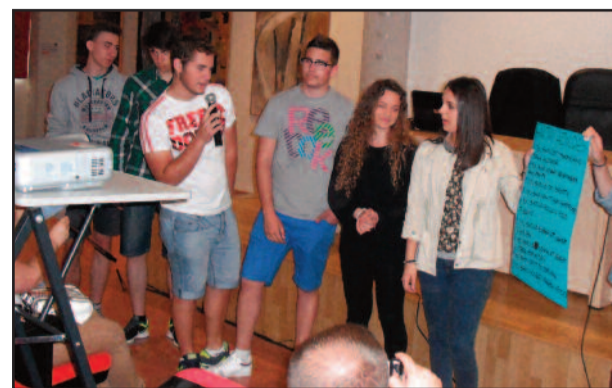
ALCUNI STUDENTI DEL PROGETTO