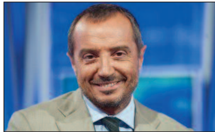
FRANCO DI MARE

giornalista Rai. E il mare, quando tira "malo tempo", in un niente può volgere a tempesta. Ma vale lo stesso se la donna in questione è una statua di marmo, un opulento nudo di Botero il cui sedere da tre tonnellate guarda malauguratamente in direzione di una chiesa? È quel che succede a Bauci, piccolo borgo a strapiombo sulla costiera amalfitana, diventato località alla moda grazie a un festival artistico che quest'anno celebra appunto il maestro colombiano. Quando don Enzo, il parroco, vede l'opera al centro della piazza va su tutte le furie: come si può concepire tale oscenità, peraltro a pochi giorni dalla visita del vescovo? Ma toglierla non si può. Spostarla neppure. Cosa fare, dunque? Se lo chiede Rocco Casillo, il sindaco, al quale la statua serve per coronare i suoi sogni politici, e se lo chiede l'intera, colorata comunità di Bauci. Strane dicerie e fatti inspiegabili si susseguono fin quando, ai piedi dell'imponente chiattona, compare un fagotto con dentro una neonata. La pietra dello scandalo è servita. In un romanzo che sembra già un classico, Franco Di Mare dirige un coro formidabile di furbizie e rivalità, di voltafaccia e colpi di genio. E