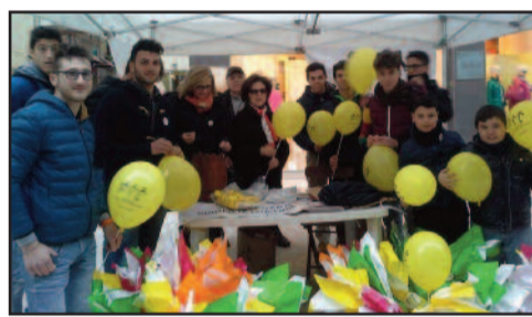
I VOLONTARI AIL IN PIAZZA

grande umiltà, come del resto avviene da più di dieci anni, affiancati dagli studenti di alcune scuole marsalesi che hanno distribuito palloncini e materiale divulgativo/illustrativo riguardante l'associazione. L'AIL ringrazia la cittadinanza tutta e l'Amministrazione comunale per aver contribuito al successo dell'iniziativa.