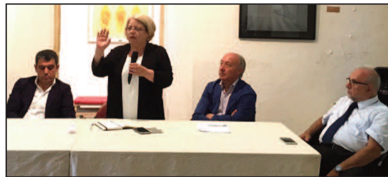
UN MOMENTO DELLA CONFERENZA

“Oggi iniziamo un percorso e, di fatto, entriamo nella fase operativa di questo progetto avviato dal Patto dei Sindaci e proseguito con l'approvazione del Paes. Sono 220 i Comuni che hanno seguito questo iter, ora entriamo nel concreto della sua attuazione ma occorrono i finanziamenti”. Con queste parole la vicepresidente della Regione Mariella Lo Bello (titolare alla delega alle attività produttive), ha illustrato passaggi che porteranno i Comuni che hanno già adottato il “Piano d'Azione per l'Energia Sostenibile” a fruire dei fondi europei nel campo dell'efficientamento energetico. Introdotta dal sindaco Alberto Di Girolamo, la vicepresidente della Regione ha partecipato a un incontro pubblico tenutosi al Convento del Carmine di Marsala, affiancata dal professore Antonello Pezzini (consulente per l'energia del Governo regionale) e dagli ingegneri Domenico Armenio (dirigente del dipartimento regionale energia) e Francesco Cappello (Enea-Palermo). “Marsala, in materia di efficienza energetica – ha proseguito l'assessore Lo Bello – è un ente virtuoso, godendo di una situazione ottimale per concretamente proseguire