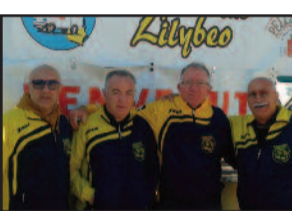
I COMPONENTI DEL CAMPER CLUB LILYBEO