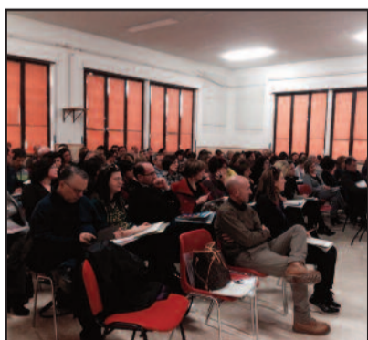
UN MOMENTO DEL CORSO