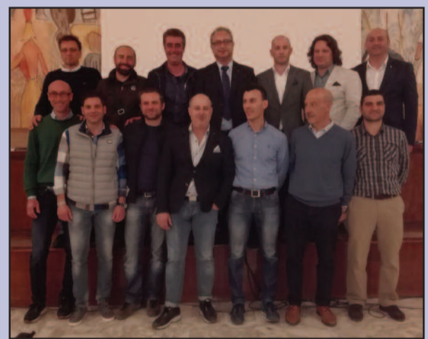
COMPONENTI DEL CONSIGLIO DIRETTIVO DI ASSOENOLOGI