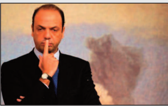
IL MINISTRO ANGELINO ALFANO

[ Angelino in giardino ] - E infatti si è visto come la nostra Regione, che è quella dove è nato il ministro, si è salvata. In attesa però cercate, signori del governo, almeno di "salvare" questi nostri sfortunati amici che fuggono dalle guerre (spessissimo) e dalla miseria (sempre). Vogliono andare a raggiungere i familiari nei paesi europei e il ministero che deve esaminare le richieste li fa attendere senza motivo. Ma che ha da fare il ministro? Abbiamo fatto una nostra personalissima ricerca nello scorso fine settimana per appurare dove e cosa facesse il ministro siciliano. Dovendo salvare la sua Isola era ad Agrigento a trascorrere il week end e, come riporta il quotidiano La Stampa, lo ha trascorso leggendo libri di storia "una sua antica passione...mentre si sta preparando alla ripresa autunnale". Ora la lettura dei libri di storia è tipica degli uomini di cultura liberale, come Alfano si è sempre definito, ma a giudicare dai risultati non ne ha mai tratto tanto giovamento. Così, non so se ci capite, per emulazione, mentre i migranti sono abbandonati al loro destino, il ministro aspetta l'autunno. Chissà come lo fa: forse si nasconde dietro gli alberi, o si appiatta dietro i cespugli? Noi abbiamo una proposta, visto che come ministro degli Interni ha funzionato poco, saremmo lieti di vederlo al ministero della ricerca scientifica: infatti egli è un uomo indispensabile ai fisici per capire il concetto di vuoto.