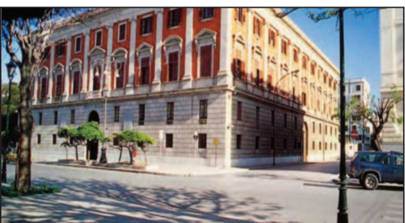
LA SEDE DELLA PROVINCIA

La Giunta della Regione Sicilia, con deliberazione n.313 del 27 settembre 2016, ha stabilito che siano indette, per domenica 20 novembre, le elezioni per il Presidente e per i Consigli dei Liberi Consorzi Comunali. Come disciplinato dalla legge regionale n.15/2015 si tratta di elezioni di secondo livello che prevedono quale elettorato attivo e passivo, soltanto sindaci e consiglieri comunali in carica dei 24 comuni della provincia di Trapani, saranno loro ad esprimere la preferenza. Giorni fa è stata pubblica una nota informativa per la disciplina delle candidature e dello status degli amministratori del Libero Consorzio Comunale di Trapani. Le candidature per l'elezione del Presidente