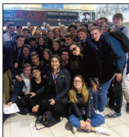
UN MOMENTO DELL'INCONTRO PRESSO L'AEROPORTO