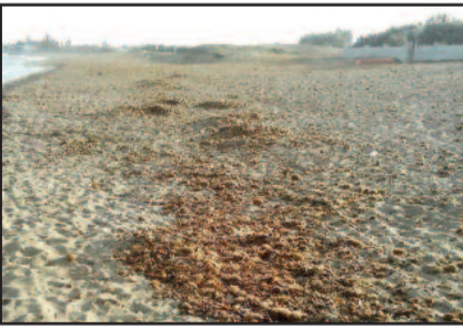
LA SPIAGGIA DI SIBILIANA

Torniamo a parlare della spiaggia di Torre Sibiliana, a Petrosino, una baia di grandi bellezze naturali, che purtroppo ogni anno viene presa di mira da persone incivili, che gettano i propri rifiuti sulla spiaggia, non curanti di ordinanze e divieti posti dall'Amministrazione comunale. Proprio in questi giorni un gruppo di cittadini ha raccontato al nostro giornale la situazione in cui si trova attualmente la spiaggia di Torre Siciliana: sabbia sicuramente pulita dal punto di vista della spazzatura, ma che in certi tratti risulta impraticabile a causa di cumuli di alghe secche che generano odore sgradevole. A detta dei cittadini in questione, la spiaggia andrebbe bonificata e le alghe e le spugne di mare rimosse per poter conferire alla spiaggia la sua naturale bellezza e quindi potere essere fruita in tutta sicurezza dalle famiglie e dai turisti. Ricordiamo però, che la procedura per rimuovere la posidonia segue un iter molto severo in quanto si tratta di una pianta protetta. [ ro.ma ]