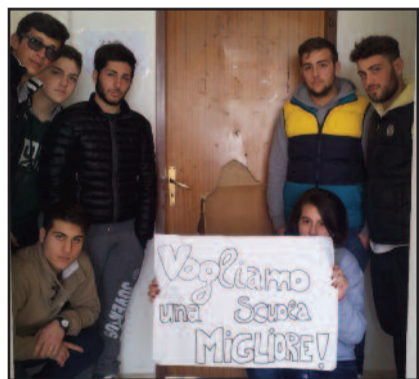
GLI ALUNNI DELL'ISTITUTO DAMIANI

letto bloccato e non funzionante. Problemi anche per i disabili, visto che l'ascensore pare non funzioni e che non ci sarebbero rampe idonee. Le lamentele hanno riguardato anche aspetti legali alla didattica, visto che anche l'aula multimediale sarebbe poco accessoriata e quasi inutilizzabile. Gli alunni hanno anche segnalato la mancanza di riscaldamenti nelle aule. "Si richiedono dei provvedimenti per risolvere tutti i problemi - hanno scritto i rappresentanti di classe -. Nel caso in cui la nostra lettera venga ignorata, non porteremo avanti il libero svolgimento delle lezioni". Il preside si è dimostrato disponibile con gli studenti, ma l'ente competente è il Libero consorzio dei comuni, ex Provincia a cui tecnici do-