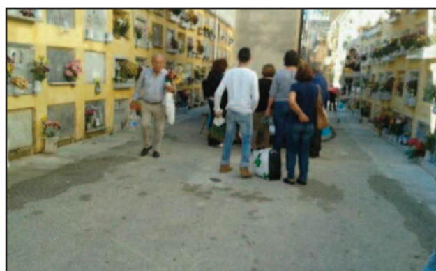
CITTADINI IN FILA AD UNO DEI POCHE RUBINETTI FUNZIONANTI

In occasione della prossima ricorrenza della festività di Ognisanti e della Commemorazione dei defunti (1 e 2 novembre), le visite al Cimitero urbano di Marsala potranno effettuarsi dalle ore 7 alle ore 17, con orario continuato. Il Commissario Straordinario Giovanni Bologna, ha altresì disposto la pulizia straordinaria dell'area cimiteriale nel pomeriggio di venerdì 31 ottobre. Per quella giornata pertanto, a partire dalle ore 13 - al fine di agevolare il lavoro degli operatori ecologici - sarà vietato l'ingresso ai luoghi di sepoltura. Si tratta della tradizionale visita che il giorno della ricorrenza dei defunti i marsalesi fanno alle tombe dei propri cari. E come ogni anno è tradizionale anche la lamentela dei nostri lettori che ci scrivono denunciando disservizi all'interno del cimitero urbano. Quest'anno sembra che il problema idrico abbia la prevalenza sulla cattiva pulizia denunciata negli anni passati. "Parecchi rubinetti dislocati un po' dovunque - ci scrivono - risultano non funzionanti e il giorno dei morti nei pochi rubinetti funzionanti si creano delle lunghe fila. Se l'acqua arriva all'interno del camposanto, come mai non si provvede ad erogarla su tutti gli sbocchi predisposti?" Già in pas-