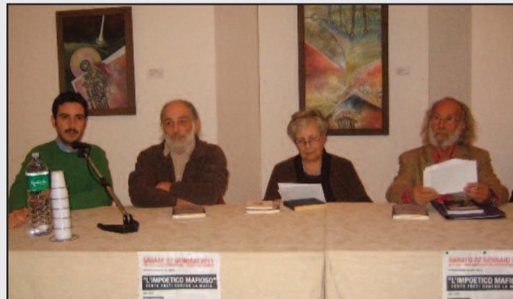
UN MOMENTO DELL'INIZIATIVA TENUTASI A MARSALA NEL 2011