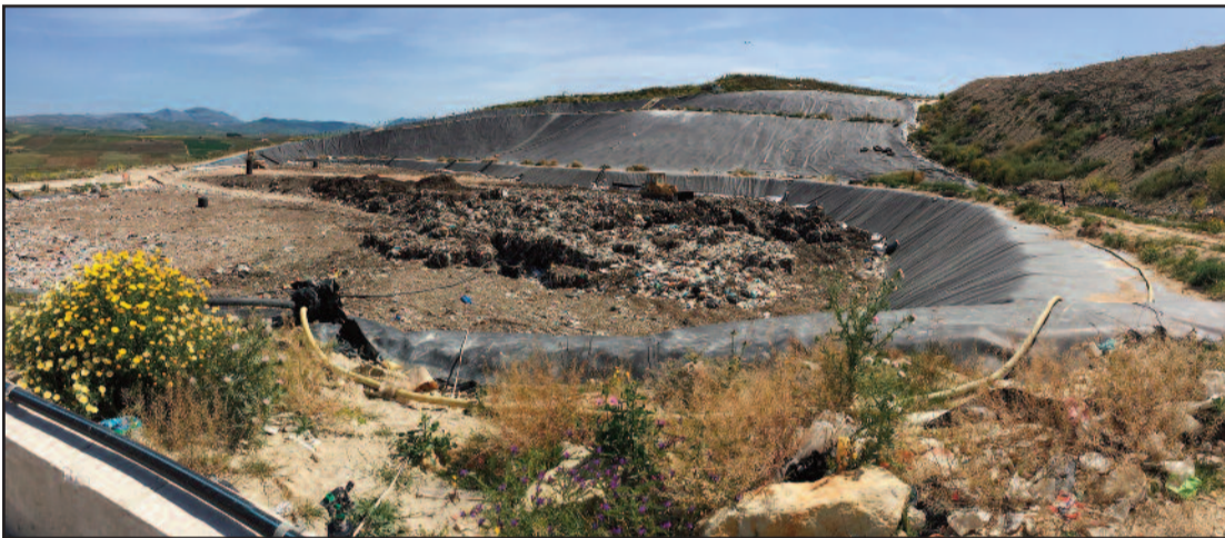
LA DISCARICA DI BORRANEA