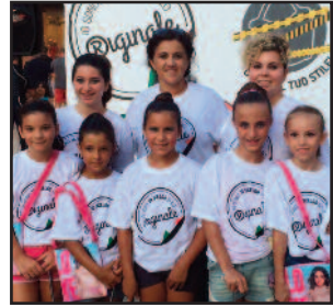
UN MOMENTO DEL FLASH MOB

Il flash mob di a Marsala è l'ultimo di una serie di eventi in giro per l'Italia, nell'ambito del progetto "Io Sono Originale", l'iniziativa finanziata dal Ministero dello Sviluppo economico - Direzione Generale per la Lotta alla Contraffazione - UIBM e realizzata da Confconsumatori con le associazioni dei consumatori per sensibilizzare i cittadini sulla contraffazione e sulla tutela della proprietà industriale. E' stato allestito un punto informativo dove è stato distribuito il nuovo Vademecum di Confconsumatori ed è stato realizzato un flash mob con un ballo collettivo dalle majorettes del "Team Golden Majorettes" di Marsala e dall'Asd "Le Farfalle" di Mazara del Vallo, oltre alle scritte impresse a terra fruttando la sola azione dell'acqua o del gesso lavabile sui marciapiedi e nelle piazze per una comunicazione "ecologica".