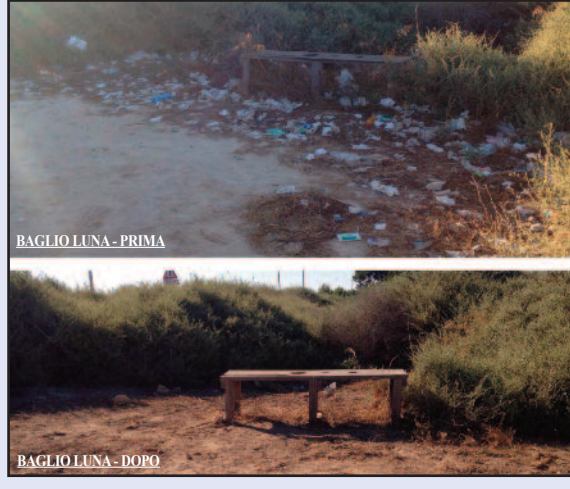
BAGLIO LUNA - PRIMA

L'associazione Vivere Marsala ieri ha organizzato un'iniziativa denominata "Pulizia Tardiva" nella zona antistante il pontile Baglio Luna nella Riserva Naturale dello Stagnone. I ragazzi, armati di guanti e rastrelli, hanno iniziato i lavori alle 7 di mattina, raccogliendo e differenziando ben 60 sacchi di immondizia da consegnare nella vicina isola ecologica di Cutusio. Alla luce delle infinite questioni sulla gestione dell'area, si appellano in particolare al senso civico dei marsalesi e dei turisti che visitano questo patrimonio di bellezza al rispetto della natura per mantenere incontaminata l'area.