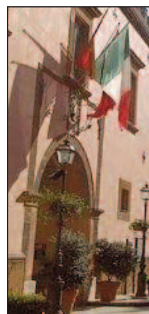
L'INGRESSO DEL COMUNE