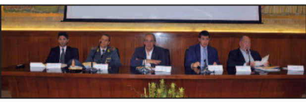
UN MOMENTO DELL'INIZIATIVA