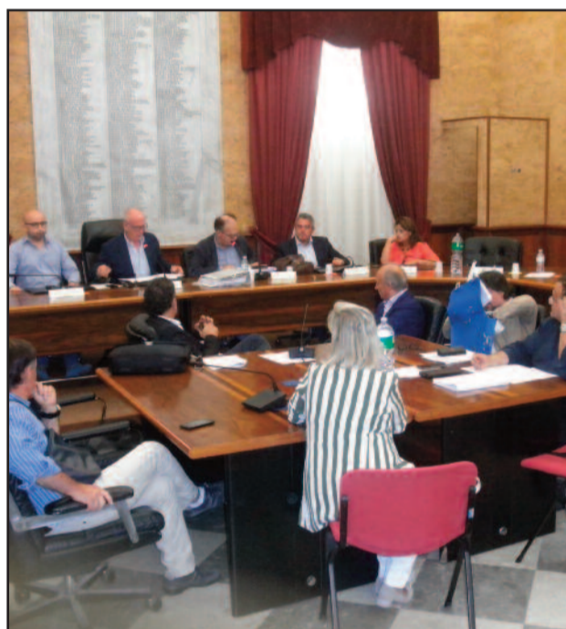
UN MOMENTO DELLA SEDUTA DI IERI