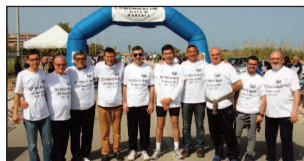
L'ACLI ALLA MARATONINA DEL VINO