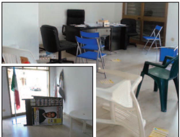
NELLE FOTO IL COMITATO DEL M5S