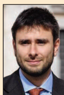
ALESSANDRO DI BATTISTA

presidenza della Regione, Giancarlo Cancelleri. Saranno presenti tutti i candidati al rinnovo dell'Assemblea regionale siciliana per la Provincia di Trapani, oltre che i deputati della Provincia. Marsala è una delle tre città - insieme ad Alcamo e Mazara del Vallo - del trapanese scelta dal Movimento 5 Stelle fondato da Beppe Grillo e Gianroberto Casaleggio, per il #ATuttaSiciliaTour.