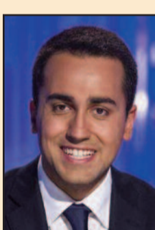
LUIGI DI MAIO

In vista delle elezioni regionali siciliane, che si terranno il prossimo 5 novembre, il Movimento 5 Stelle organizza un tour che toccherà anche la città di Marsala. Il 23 agosto prossimo, in piazza Loggia, alle ore 21, si terrà un incontro con gli elettori lilybetani. Saranno presenti il vice presidente della Camera, Luigi Di Maio, il deputato nazionale Alessandro Di Battista ed il candidato alla