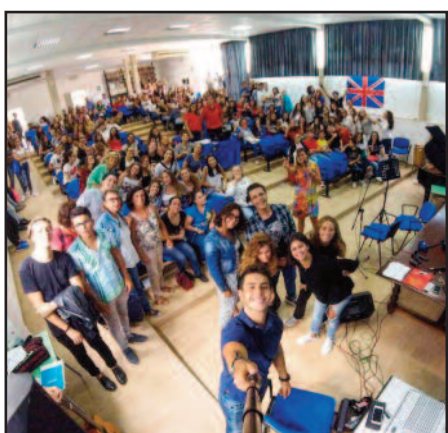
IL SELFIE DI STUDENTE E INSEGNANTE A FINE MANIFESTAZIONE

Grande entusiasmo tra gli studenti del Liceo Statale "Pascasio" che, con l'aiuto degli insegnanti del dipartimento di lingue, hanno realizzato nell'aula magna della sede di via Falcone una performance di sketch, poesie e canzoni in inglese,