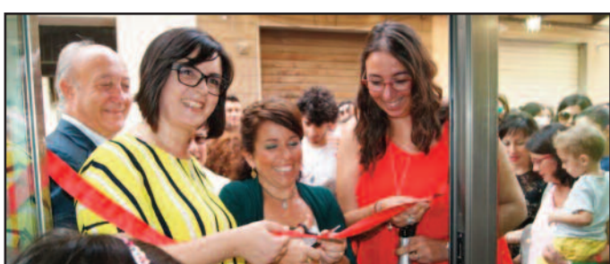
UN MOMENTO DELL'INAUGURAZIONE

gestori dell'Albero delle Storie nell'accoglienza dei tanti visitatori, i ragazzi dell'Opera Santuario Nostra Signora di Fatima e il clown de "Lisola" che hanno regalato sorrisi, palloncini e caramelle. La libreria sarà aperta dalle 9 alle 13 e dalle 16.30 alle 19.30, ogni giorno, esclusa la domenica mattina. Nell'Albero delle Storie si potrà scoprire la vasta editoria per bambini da 0 a 11 anni.