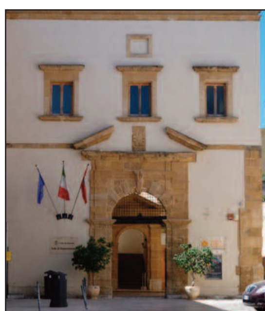
L'INGRESSO DELL'EX CONVENTO DEL CARMINE

In occasione della giornata FAMU 2016, dedicata alle famiglie al Museo, l'associazione Labalquadrato - Educazione Museale e Didattica dell'Arte in collaborazione con l'Ente Mostra Nazionale di Pittura Contemporanea Città di Marsala, propone alle famiglie partecipanti un percorso di visita ideato per far conoscere meglio non solo le opere esposte ma anche le dinamiche che determinano la gestione e l'organizzazione di un museo. La manifestazione si terrà dome-