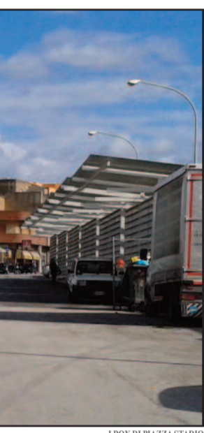
I BOX DI PIAZZA STADIO

Sono stati assegnati i nuovi box realizzati in Piazza Stadio, dopo il lungo iter, fatto di non pochi intoppi, che li ha visti protagonisti. I box sono destinati alla vendita al minuto di prodotti ortofruttili. Gli spazi assegnati dall'Ufficio Patrimonio del comune di Marsala, sono attualmente cinque (un sesto sarà successivamente assegnato), tanti quanti sono i commercianti che svolgevano attività nell'area antistante gli stessi box a cui stalli sono stati dismessi. "Un altro progetto incompiuto vede la sua realizzazione. Una questione di cui siamo stati investiti subito dopo il nostro insediamento e per la quale abbiamo trovato la giusta soluzione, in assoluta trasparenza e legalità - sottolinea il sindaco Alberto Di Girolamo -. Si pone così fine ad un degrado di quell'area che dura da anni, più volte segnalato dai cittadini e nel contempo la sede viaria torna alla sua originaria funzionalità, con più sicurezza per la circolazione veicolare". Nei giorni scorsi, il dirigente del Settore Lavori Pubblici, Gian Franco D'Orazio, aveva convocato al Comune gli aventi diritto e, sulla scorta della documentazione prodotta, aveva proceduto al sorteggio degli spazi. Il canone di locazione è fissato in 165 euro mensili, per un totale annuo di quasi 2mila euro. Restano a carico della ditta assegnataria le utenze di acqua e luce. Subito dopo la stipula dei contratti di locazione, il Comune procederà alla consegna materiale dei box.