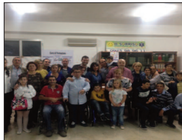
UN MOMENTO DELL'INIZIATIVA

È tornata a riunirsi presso i locali della sede di contrada Bosco, 343, l'associazione di volontariato "Raggio di Sole Onlus". Costituita nel 2013, l'associazione si propone come grande obiettivo la realizzazione di un centro residenziale "Dopo di noi" ma allo stesso tempo vede impegnati i propri soci a monitorare, far osservare e difendere i diritti di tutti gli amici diversamente abili del territorio marsalese. Particolarmente impegnata nell'ultimo periodo, "Raggio di Sole" sta seguendo con attenzione alcune tematiche che stanno molto a cuore ai disabili e alle loro famiglie, come ad esempio la regolarizzazione per