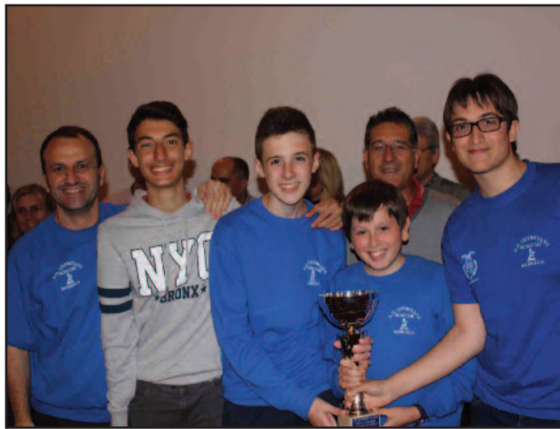
I CAMPIONI REGIONALI