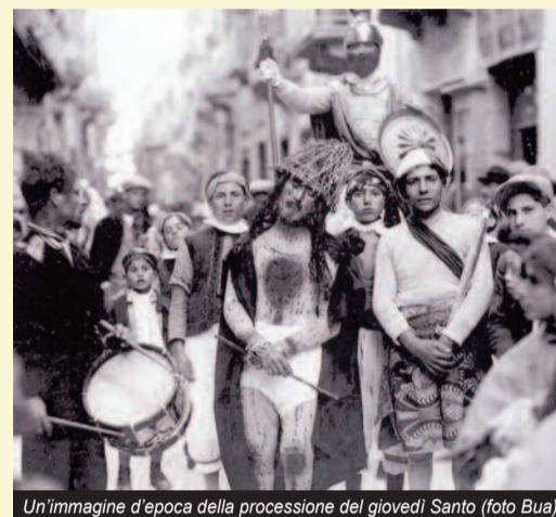
Un'immagine d'epoca della processione del giovedì Santo

che lega le mani del Cristo. 7° Cristo che porta la Croce sulle spalle, aiutato dal Cireneo e trascinato da un giudeo; una fanciulla, la Veronica, che di tanto in tanto va ad asciugare la faccia di Cristo con un velo bianco, dov'è l'effigie del Cristo. 8° Un centurione pentito a cavallo, giudei che portano scale, un calamaio, dei chiodi, dei dadi, la sacra sindone, dei vasi unguentari, dei martelli, Disma e Cisma dipinti e alzati in croce, e la figura, anch'essa dipinta, del Cristo Crocifisso; quindi segue Giuseppe d'Arimatea, Nicodemo, Giovanni, molti fanciulli e ragazze, vestiti alla giudea che piangono accanto alla salma di Gesù depresso e portato da loro. La statua di Maria Addolorata conclude la processione. [giovanni alagna]