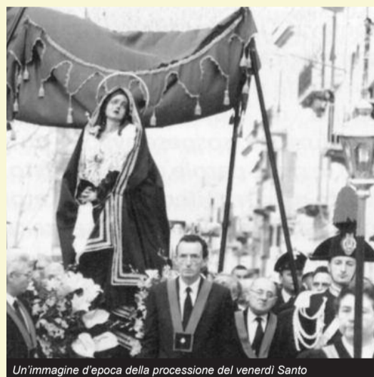
Un'immagine d'epoca della processione del venerdì Santo