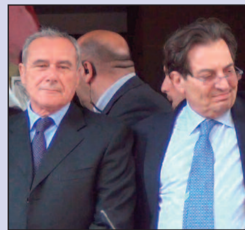
PIETRO GRASSO E ROSARIO CROCETTA