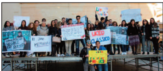
GLI STUDENTI IN PIAZZA DELLA REPUBBLICA