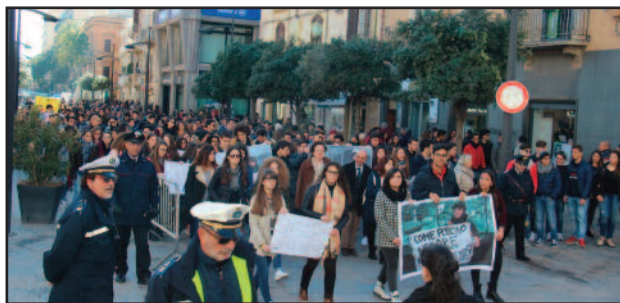
GLI STUDENTI IN CORTEO IN PIAZZA MATTEOTTI