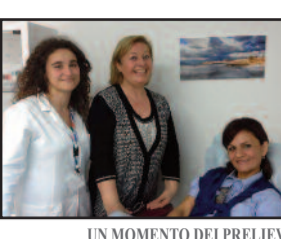
UN MOMENTO DEI PRELIEVI

Raccolta straordinaria di sangue oggi all'Avis di Marsala. In via Bruzzesi (traversa di via Mario Nuccio), i donatori possono recarsi dalle ore 8 alle ore 12.30 per il prelievo o effettuare il test di idoneità. La donazione in giornata feriale - come oggi - dà diritto alla giornata di riposo per i lavoratori dipendenti.