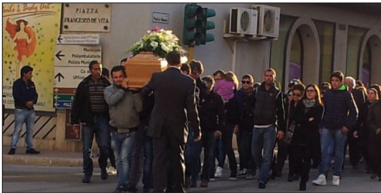
IL CORTEO FUNEBRE DAVANTI LA CHIESA MADRE DI PETROSINO

PROSEGUONO LE INDAGINI DELLA POLIZIA MUNICIPALE PER FAR LUCE SULLA DINAMICA DELL'INCIDENTE