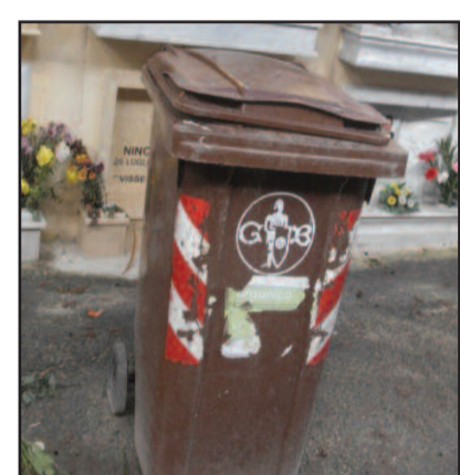
IL CASSONETTO IN CUI SONO STATE RITROVATE LE OSSA