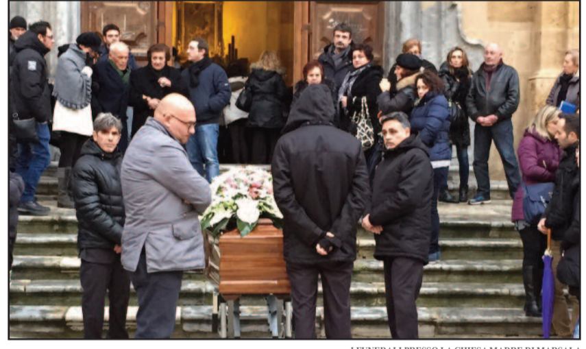
I FUNERALI PRESSO LA CHIESA MADRE DI MARSALA