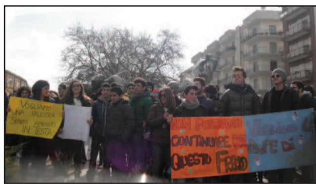
IL CORTEO A PIAZZA INAM

sto freddo", "Vogliamo le pompe di calore" sono alcune delle scritte nei cartelli esposti dagli studenti. In pratica la protesta dei ragazzi verte su varie problematiche. L'edificio di via Trapani è inadeguato, i corridoi sono troppo stretti e non a norma di legge; le aule si allagano quando piove perché gli infissi sono fatiscenti. "E" da 37 anni che la Provincia paga un sacco di soldi di affitto - dicono gli studenti - per garantire una struttura scolastica non