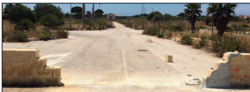
IL LUOGO DA CUI È STATO SRADICATO IL CANCELLO DI CANTIERE

Fu inaugurata nel 2008, ma allo stato attuale si presenta ancora come un'incompiuta. L'area artigianale di contrada Amabilina, concepita con l'idea di creare un nuovo spazio riservato all'imprenditoria marsalese e di contribuire alla riqualificazione del quartiere, è ancora molto lontana dall'aspetto che avrebbe dovuto avere. A nove anni dalla conclusione dei lavori, dei capannoni immaginati non c'è ancora alcuna traccia e il Comune risulta in ritardo nel completamento degli oneri di urbanizzazione (allacciamenti alla rete elettrica e alle fo-