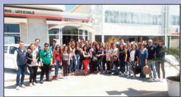
Nelle foto gli studenti in visita nelle aziende di Rete Punica