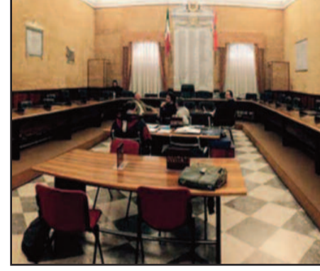
AULA CONSILIARE DI PALAZZO VII APRILE

mento alle "previsioni" (delegate ai piani urbanistici locali). Ciò non vale invece per le "prescrizioni" (ad esempio le zone rosse dello Stagnone), per le quali rimangono in vigore le norme di salvaguardia. "Nei prossimi giorni - ha detto l'assessore intervenendo in Aula -, in un apposito incontro con il dirigente Patti e il legale incaricato, approfondiremo la questione". I lavori del Massimo Consesso Civico continueranno nella giornata di oggi alle ore 16,30. [ g. d. b. ]