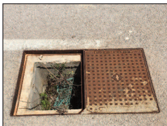
UN TOMBINO DIVELLTO