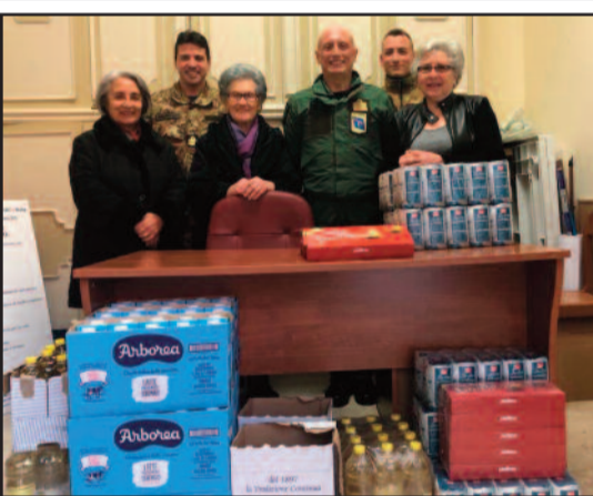
UN MOMENTO DELLE CONSEGNE

Con le prime consegne ad alcune associazioni dei beni acquistati con i fondi raccolti durante l'evento di solidarietà e beneficenza "I Am For Life" tenutasi presso il 37° Stormo di Birgi lo scorso 17 novembre, si concretizza il generoso supporto nei confronti dei più bisognosi della Provincia di Trapani. Oltre 180 kg di derrate alimentari e articoli per neonati sono stati distribuiti al Movimento per la vita. Ulteriori 180 kg di alimenti sono stati distribuiti anche alla Parrocchia San Filippo e Giacomo di Marsala. Sono state invece destinate rispettivamente di un "robot lanciatore palline" e di un "biliardino", l'ASD Germaine Lecocq (associazione di tennista-volo disabili) e il Centro diurno Helios di Marsala. La consegna prima delle festività natalizie era uno degli obiettivi che il Colonello Salvatore Ferrara, Comandante del 37° Stormo, aveva definito in modo da suggellare il