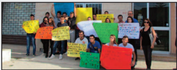
UN MOMENTO DELLA PROTESTA