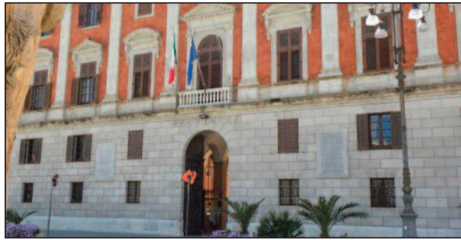
PALAZZO DELLA PROVINCIA