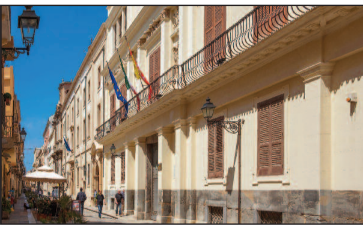
PALAZZO RICCIO DI MORANA

costituzionalità da parte della Consulta. L'unico modo per ovviare a questa situazione sarebbe stato un intervento legislativo per modificare la legge e rimuovere il vulnus sollevato dal consiglio dei ministri. Ma alla vigilia delle scorse elezioni regionali i deputati tutto hanno pensato meno che a legiferare, rinviando eventuali interventi alla attuale assemblea. Ma tra insediamenti e altri adempimenti, non se ne parlerà (se l'argomento sarà affrontato) all'inizio del 2018. Intanto tra qualche giorno dovrebbero partire le operazioni propedeutiche al voto. Prima di affrontare eventuali soluzioni che potrebbero rappresentarsi, occorre dire che l'argomento è stato del tutto assente dal dibattito politico nella scorsa campagna elettorale. L'eventuale indizione dei comizi elettorali, per certi aspetti obbligatoria come ci dicono fonti burocratiche dell'assessorato regionale agli Enti Locali e che dovrebbe portare al voto, rischia di essere inficiato dalla pronuncia della Corte costituzionale che potrebbe dare ragione al Consiglio dei ministri e giudicare la norma incostituzionale. L'im-