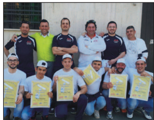
LIPARTICIPANTI AL CORSO CON I MAESTRI