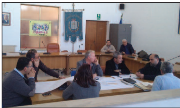
LA COMMISSIONE AL LAVORO PRESSO L'AULA CONSILIARE "VITO MARINO"

di fare chiarezza su ciò che è pubblico e ciò che è privato". Giacalone ha poi chiarito la posizione del Comune di Petrosino sull'ipotesi dell'esproprio dell'area: "Per noi è solo l'estrema ratio. Va detto comunque che la procedura di delimitazione lascerebbe fuori alcuni aspetti, tra cui la condotta idrica presente. Se la commissione ci dirà che ricade su terreno privato, noi dovremo sanare questa situazione. Al di là di questo, noi ci siamo anche chiesti in questi anni anche come va gestita l'intera area. In questa logica rientra il progetto di rinaturalizzazione che stiamo portando avanti. In ogni caso, non spenderemo un centesimo per acquistare proprietà già pubblica". [ vincenzo figlioli ]