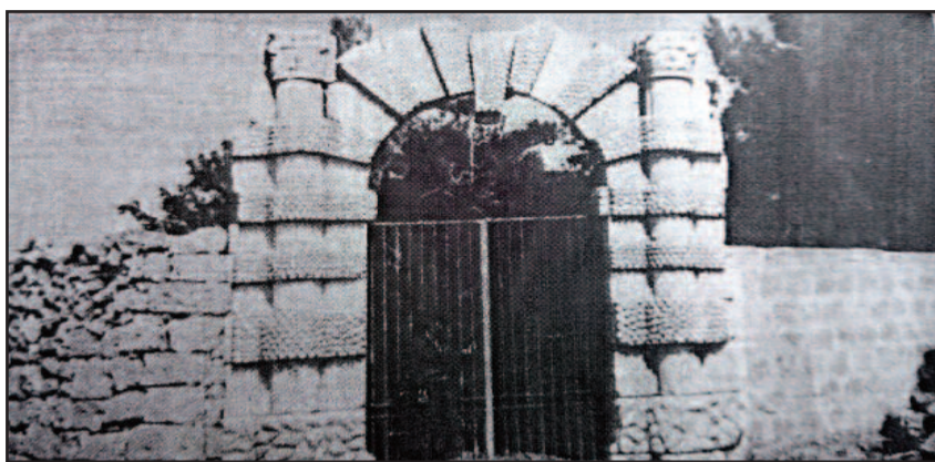
LA VECCHIA PORTICELLA