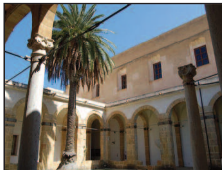
CONVENTO DEL CARMINE

"Punto di vista" è il titolo della personale di pittura di Vincenzo Basile, che sarà ospitata nella suggestiva location dell'ex Convento del Carmine, sede dell'Ente Mostra di Pittura Contemporanea Città di Marsala. L'esposizione - che verrà inaugurata il prossimo 24 gennaio alle ore 17.30 - raccoglie le opere dell'artista nel periodo 2005-2014 e sarà aperta al pubblico fino al 1° febbraio dalle 10 alle 13 e dalle 17 alle 19.